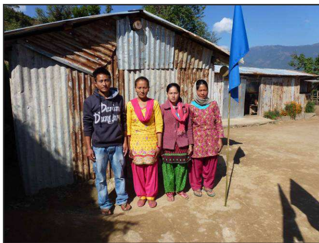
Mitarbeiterinnen und Mitarbeiter des Kindergartens

Weiterhin der Bau von Toiletten und einer Wasserstelle, sowie Kauf von pädagogischem Material.